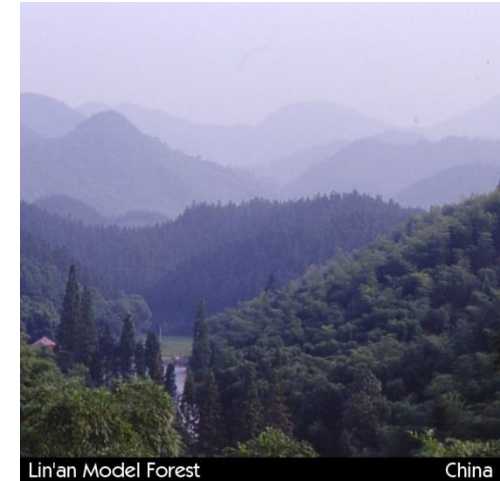
Lin'an Model Forest

Technical support is available from Mediterranean Model Forest Network and the International Model Forest Network