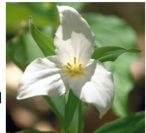
Eastern Ontario Model Forest