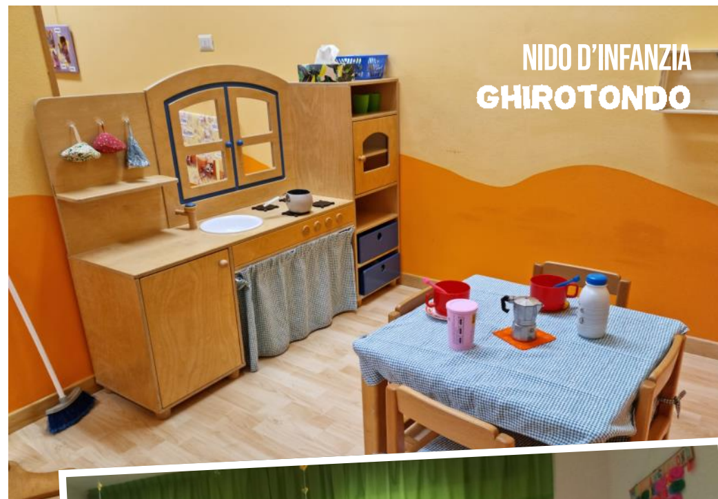
NIDO D'INFANZIA GHIROTONDO

asiloghirotondo@gmail.com - giocare@pec.wmail.it